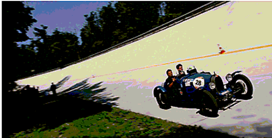
Il fascino della Mille Miglia sulle sopraelevate in autodromo