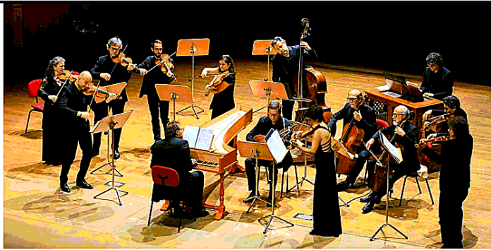
Basilica della Passione