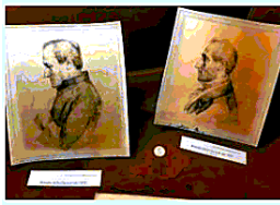
▲ Amicizia ottocentesca Alle 17,30 il convegno Manzoni, Rosmini e Tommaseo un'amicizia nella Milano dell'800