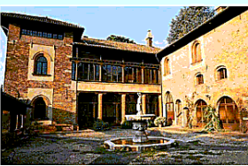
▲ Villa Mirabello Classica 2023 Da oggi al 13 luglio, alle 21, al via la rassegna Armonia tra suono e bellezza con 5 concerti nel chiostro