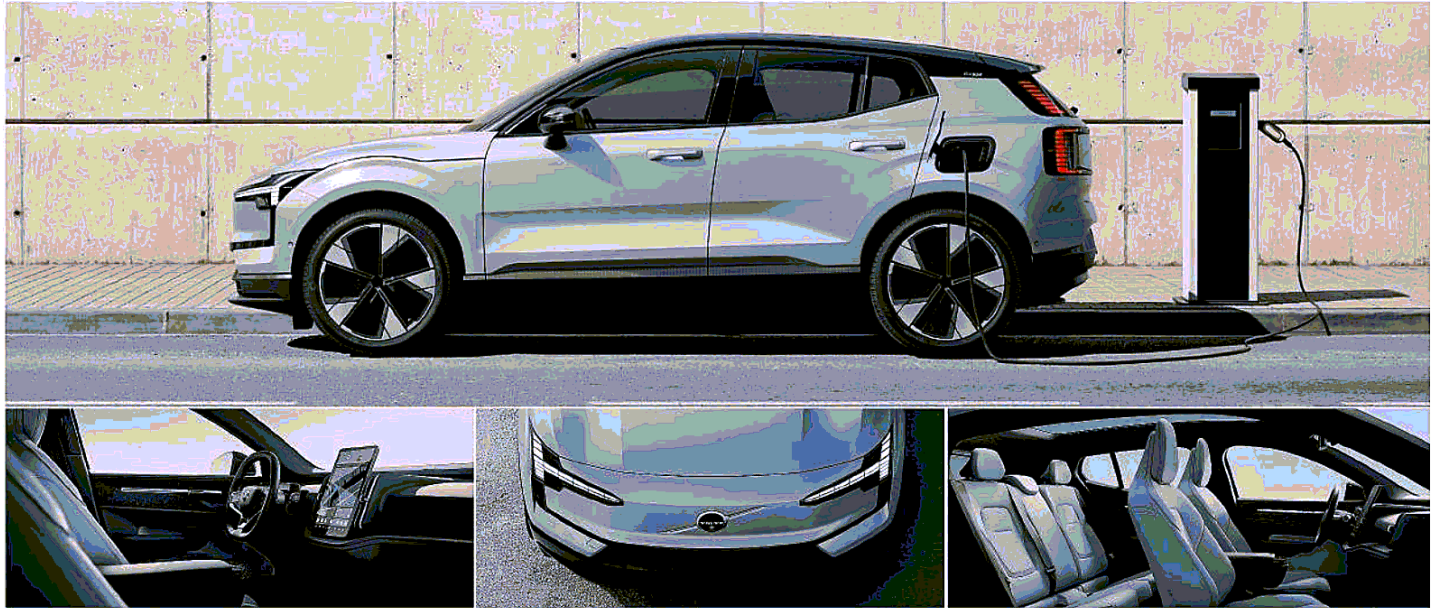
EX30 è la baby di Volvo, l'ultima nata della casa svedese, un piccolo grande Suv, completamente elettrico che arriva sul mercato italiano a partire da 35.900 euro garantendo un prezzo base equiparabile a quello di qualsiasi auto endotermica della stessa categoria

L e piccole cose fanno la differenza. Non parliamo di dettagli, ma proprio di cose